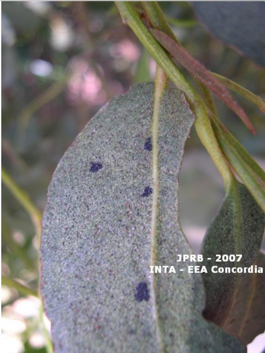
Fig.2.a) Folha de E. camaldulensis sintoma de prateamento, causado pelo percevejo bronzado do eucalipto.