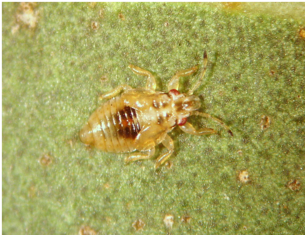
Fig. 1. Thaumastocoris peregrinus : a) adulto e b) e ninfa