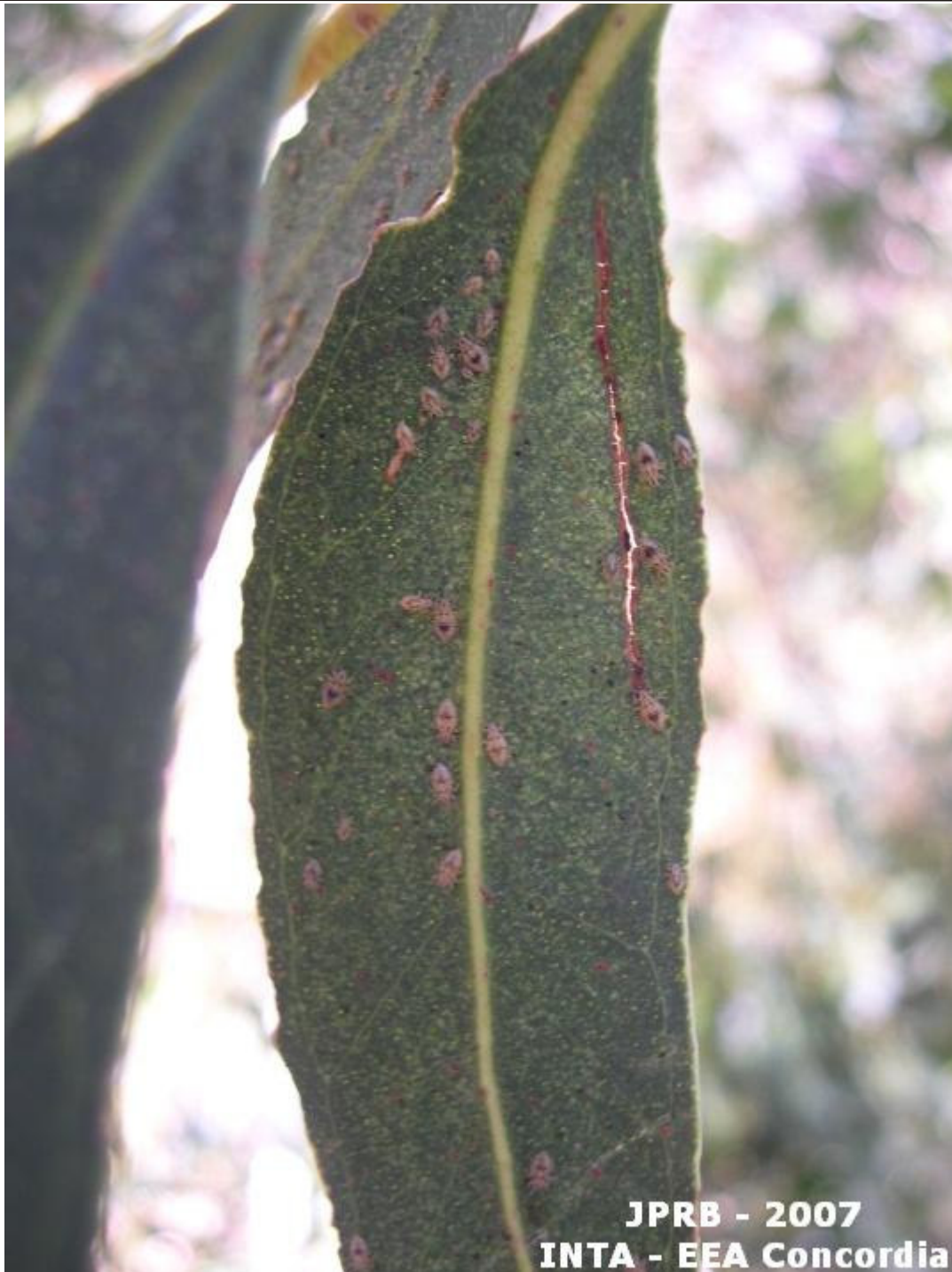
Fig.3. Folha de E. camaldulensis com ninfas do percevejo bronzeado.